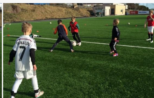
Blinkskudd fra Husøy Fotballakademi/FFO